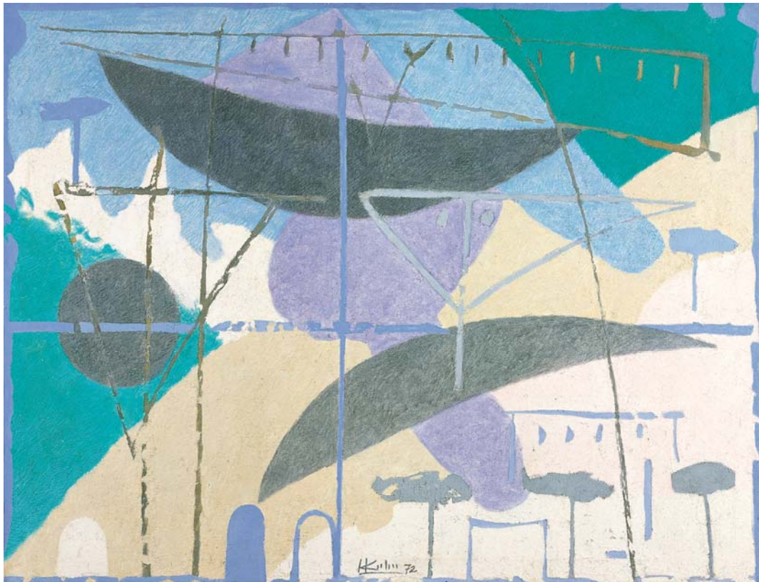
Schwarze Mondsicheln, 1972, Spachtel-Mischtechnik auf Leinwand, 100 x 130 cm