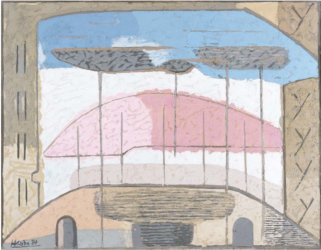
Helles Licht, 1984, Spachtel Mischtechnik auf Leinwand, 100 x 129,3 cm