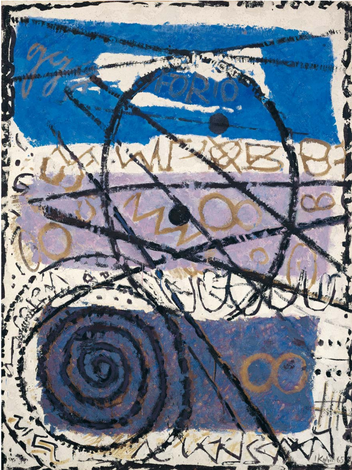
Forio, 1965, Spachtel-Mischtechnik auf Leinwand, 200 x 150 cm