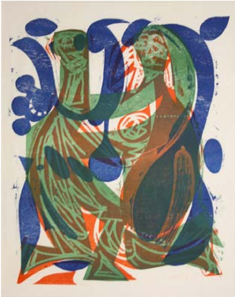
HAP Grieshaber, Paar 60, 1960, Farbholzschnitt, 61 x 49 cm

Bildmaterial zum Downloaden - Hier klicken!