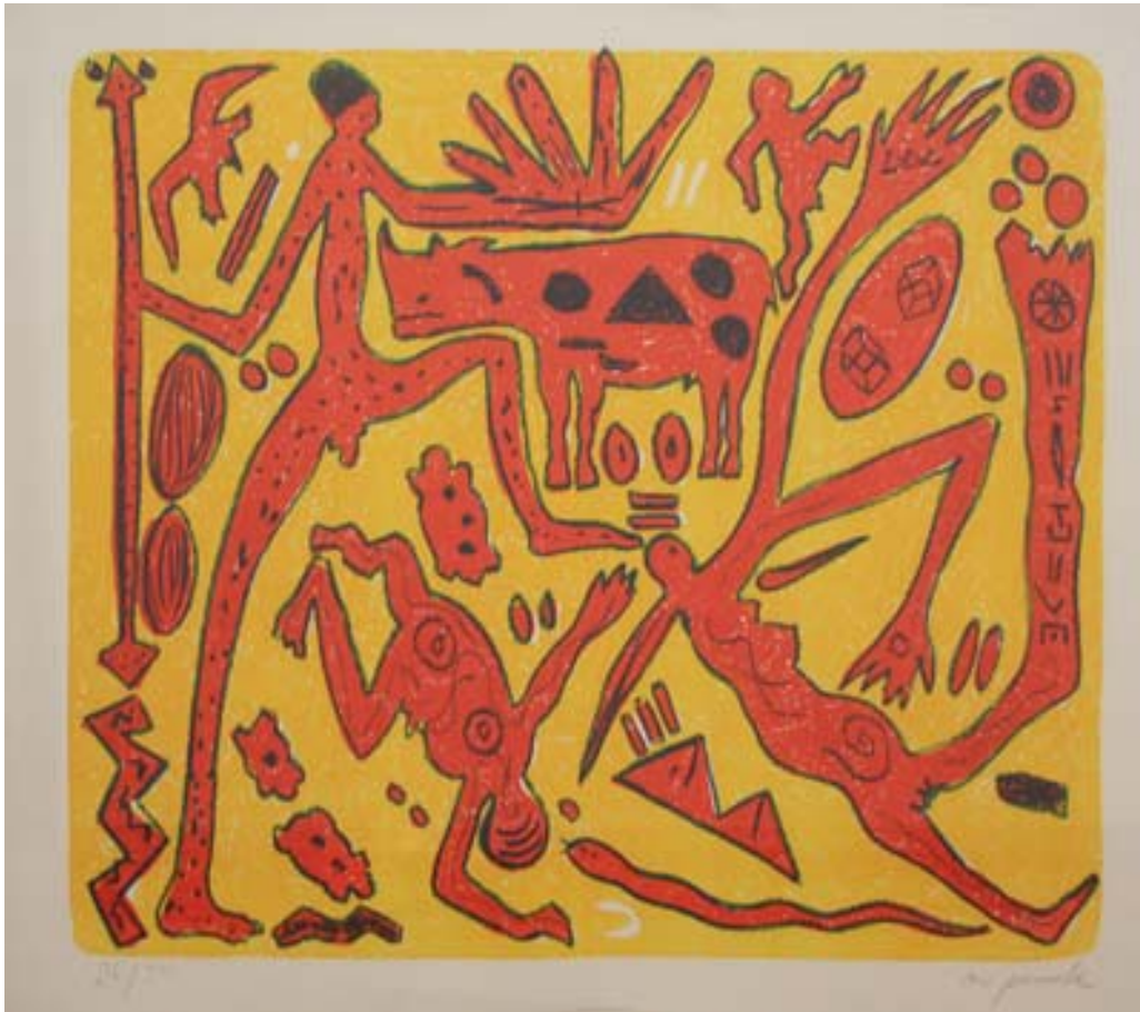
R.A. Penck, Ohne Titel, o. J., Lithografie, Exemplar 26/40, 48,5 x 60 cm