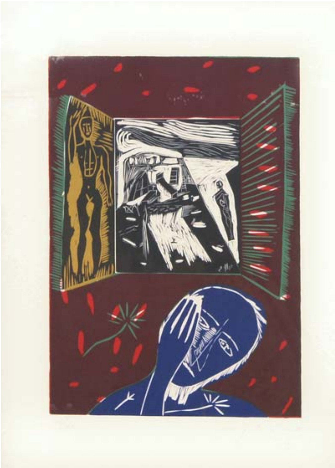
Corneille, Jes Oiseaux, 1993, Farblithografie, Exemplar 62/100, 70,5 x 101 cm