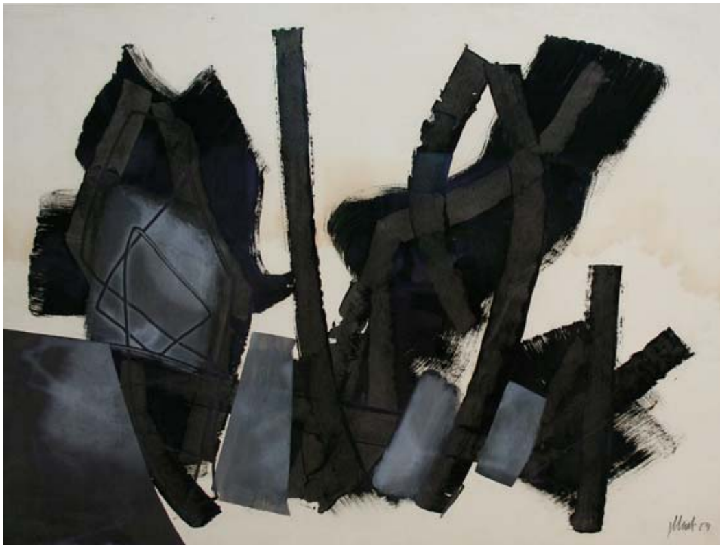
Fritz Winter, Ohne Titel, WK 1815, 1954, Öl auf Karton, 106,5 x 132 cm