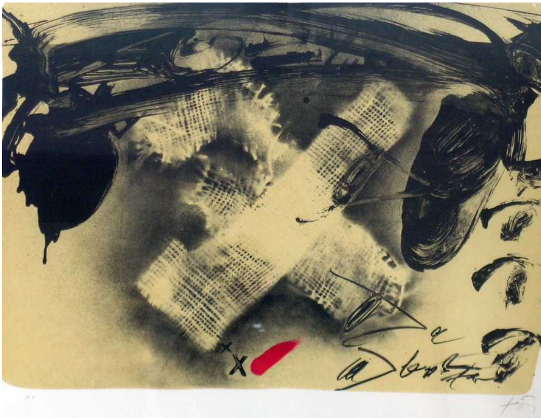
Antonio Tápies, o.T., Farblithografie, H.C., 72 x 95 cm