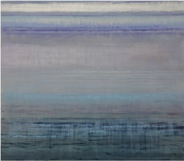
La Mer 1, 2014, Acryl, Öl, Metall, 140 x 160 cm

1957 in Langenargen am Bodensee geboren; 1980-81 Studium an der Freien Kunsthochschule Stuttgart und 1981-86 an der Staatlichen Akademie der bildenden Künste Karlsruhe. Seit 1987 arbeitet er als freischaffender Künstler. Diverse Dozenturen (Pädagogische Hochschule Karlsruhe, Staatl. Kunsthalle Karlsruhe und europäische Kunstakademie Trier). Lebt und arbeitet in Karlsruhe.