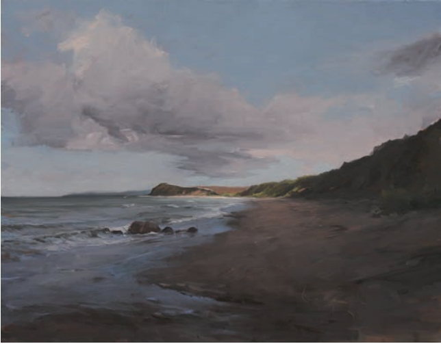
Strand Sehlendorf, 2013, Öl auf Leinwand, 70 x 90 cm

1968 in Hamburg geboren; 1992-97 studierte er Malerei und Design an der FH Hamburg bei Prof. Erhard Göttlicher und schloss 1998 sein Studium mit Diplom ab. Seither freischaffend tätig; 2009-10 Lehrbeauftragtentätigkeit für Farbe und Form an der HAW im Fachbereich Gestaltung.