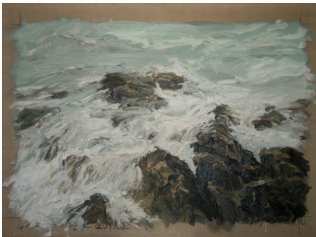
Cote sauvage 20/XII, 1981, Öl auf Leinwand, 150 x 200 cm

1951 in Freiburg im Breisgau geboren; 1973 -1978 Studium der Malerei an der Staatlichen Akademie der Bildenden Künste, Karlsruhe. Meisterschüler bei Peter Dreher; 1978 Preis des Kulturkreises im BDI; 1981 Stipendium Villa Massimo in Rom. Seit 2003 Professor für Malerei an der Akademie der Bildenden Künste, Nürnberg. Er lebt und arbeitet in Freiburg / Kirchzarten und Nürnberg.