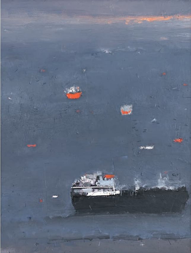
Grande matinale, 2012, Öl und Foto auf Holz, 115 x 85 cm

1955 geboren in La Canée, auf Kreta, abgeschlossenes Chemiestudium in London; 1985-88 Studium an der Académie Saint-Roch des Malers Jean Bertholle. Yannis Markantonakis lebt und arbeitet auf Kreta und in Paris.