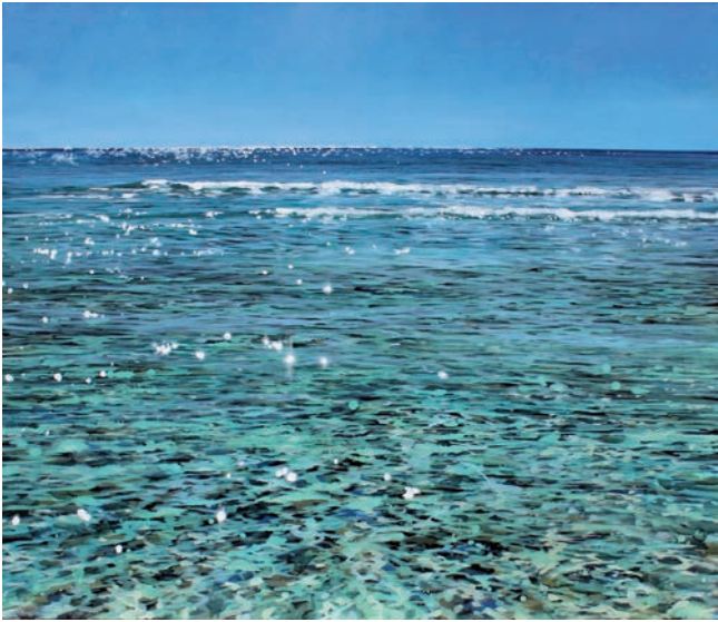
Seascape 24-11, 2011, Öl auf Leinwand, 120 x 140 cm

1962 geboren in Spisská Nová (ehemalige Tschechoslowakei); 1968 immigrierte er im Alter von 9 Jahren mit seiner Familie nach Deutschland; 1980-81 studierte er Fine Art bei Joe Doyle an der Academy of Art in San Francisco und von 1981-84 an der Hochschule der Bildenden Künste in München bei Jürgen Reipka. Bis 1994 beschäftigte er sich mit Architektur- und Umweltdesign und Illustrationen für Museen und Flugzeug. Arbeitete als Restaurator und Bühnenbildner. Seit 1996 lebt und arbeitet er auf Ibiza.