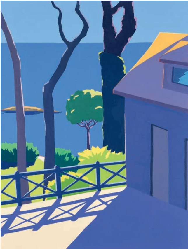
Haus am Meer, 2013, Öl auf Leinwand, 120 x 90 cm

1957 geboren in Itzehoe; 1978-85 Studium an der Hochschule der Künste, Berlin, Meisterschüler; 1985-86 DAAD-Stipendium; 1988-94 Lehrauftrag Tiefdruck/Radierung an der Hochschule der Künste Berlin; 1988-89 Stipendium für Cité des Arts, Paris; 1992 Stipendium für Deutsches Studienzentrum, Venedig; 2000-01 Lehrauftrag für Malerei an der PH Freiburg, Institut der Künste. Lebt und arbeitet in Freiburg/Breisgau.