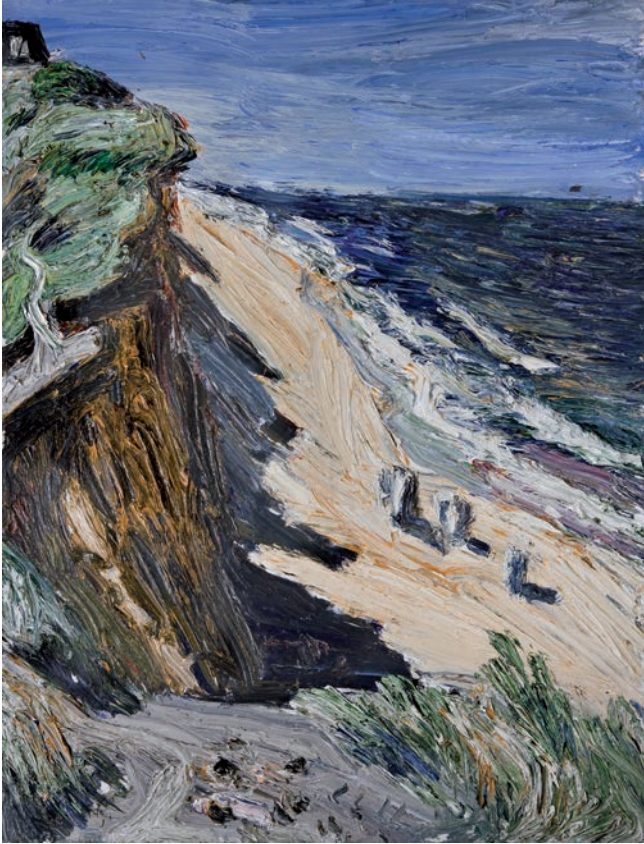
Rotes Kliff, Kampen, 2011, Öl auf Leinwand, 240 x 180 cm

1972 geboren in Berlin; 1992–98 Studium der Malerei an der HdK Berlin bei Prof. Klaus Fußmann; 1998 Ernennung zum Meisterschüler, GASAG - Kunstpreis; 1998 Mitgliedschaft Verein Berliner Künstler; 1999 Mitgliedschaft Künstler-sonderbund in Deutschland; 2000 Franz-Joseph-Spiegler-Preis der Galerie Schrade Schloß Mochental; 2001 Mitglied in der Neuen Gruppe, München; 2003 Mitglied bei den Norddeutschen Realisten; 2006 Stipendium der Bayerischen Akademie der Schönen Künste München.