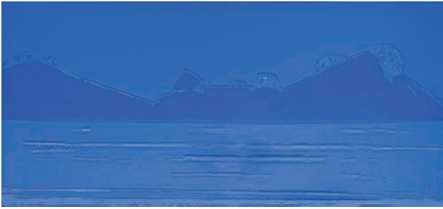
Eisberg, 2009, Plexi/Folie/Acryl, 95 x 200 cm

1952 geboren in Stuttgart. Studium Bildende Kunst und Deutsch; 1981-87 Gründung der „1. Karlsruher Produzentengalerie“; 1985-94 Arbeitsaufenthalte in Indien mit Lothar Quinte. Seit 1987 Atelier für Malerei und Performance in Wintzenbach (Elsass). Seit 2003 und 2013 weitere Ateliers in Berlin.