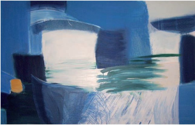
Am Ufer, 2013, Eitempera auf Nessel, 100 x 160 cm