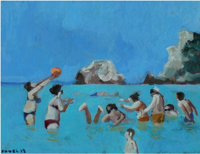
Korfu 1764, 2013, Aquarelle/ Gouache, 18 x 24 cm

1960 in Moskau geboren; 1978 -79 studierte er an der Kunstfachschule Duschambe; 1980 emigrierte er nach Berlin, wo er auch von 1980-85 Studium an der Hochschule der Künste, Berlin, Meisterschüler bei Prof. G. Bergmann war. Lebt und arbeitet in Berlin.