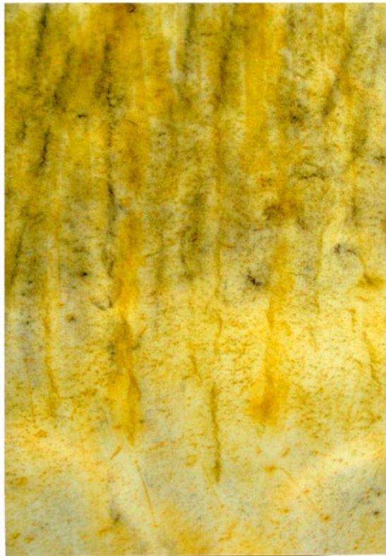
Einladung zum Ocker, Polyfrottage, 2013, Öl auf Leinwand, 100 x 70 cm