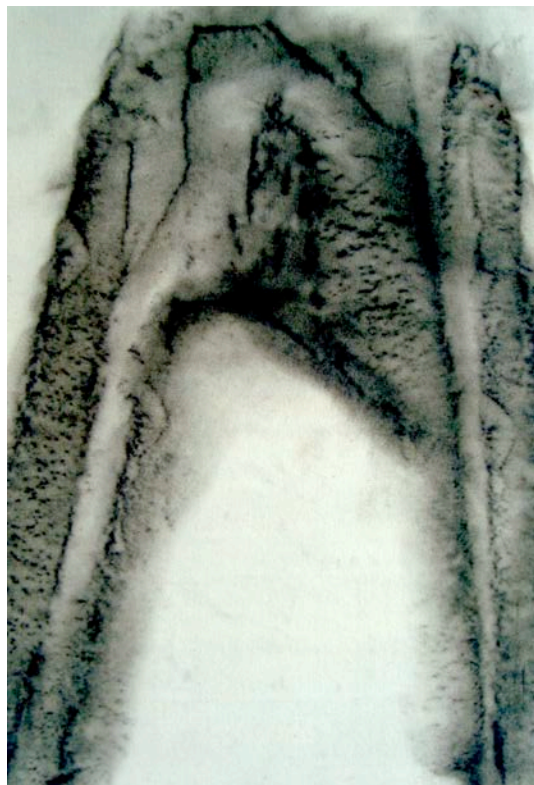
Höhle, Aushöhlung, Polyfrottage, 2013, Öl auf Leinwand, 100 x 70 cm