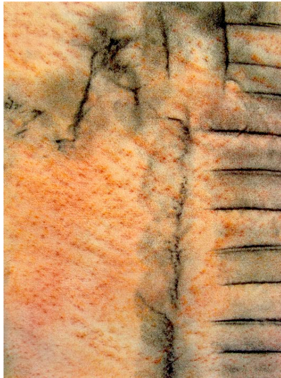
Porte Ouverte/ Offene Tür, Polyfrottage, 2013, Öl auf Leinwand, 60 x 50 cm