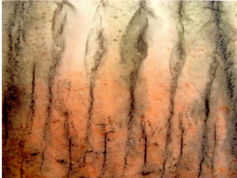
Offener Tagebau, Polyfrottage, 2013, Öl auf Leinwand, 50 x 60 cm