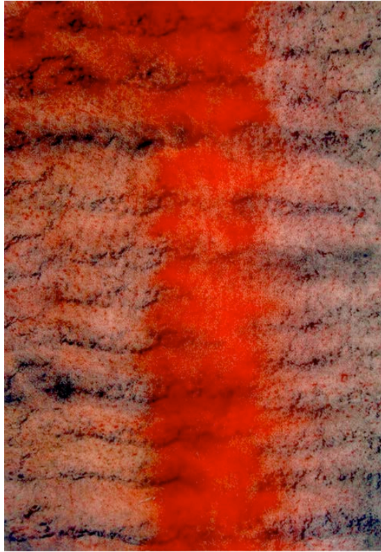
Sable Rouge 2, Polyfrottage, 2013, Öl auf Leinwand, 100 x 70 cm